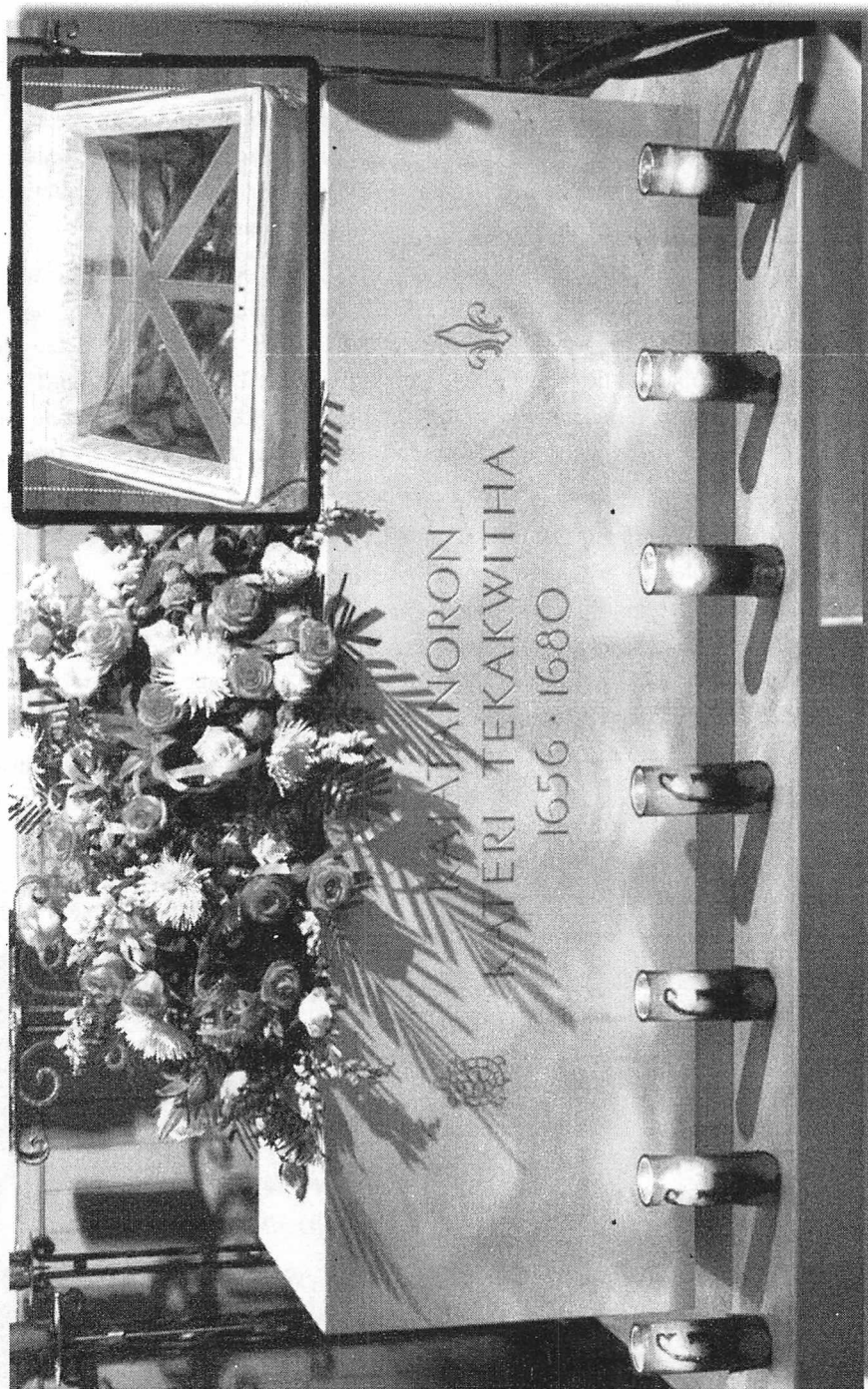
Saint Kateri's Tomb containing her relics (frame) - Le tombeau de Sainte-Kateri contenant ses reliques (encadré)