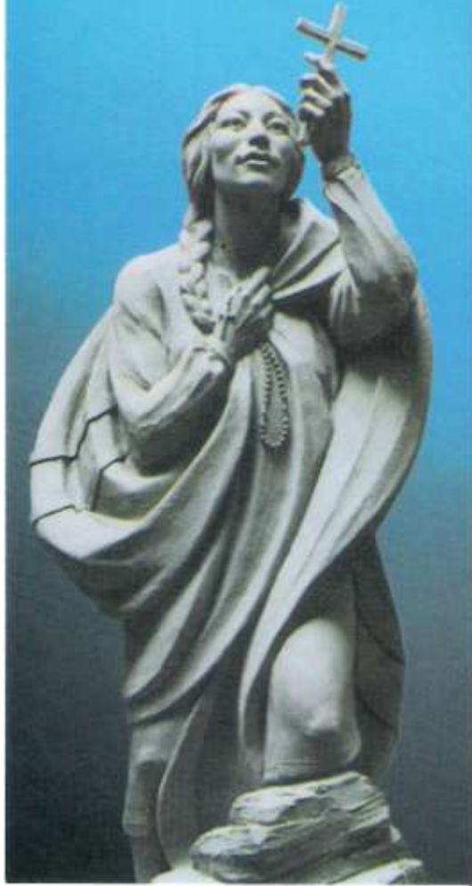
聖女凱德莉愛慕聖十字架