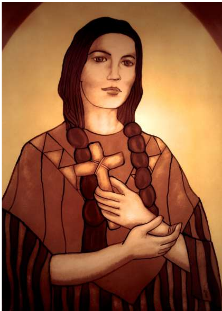
彩色玻璃：丁松青神父作