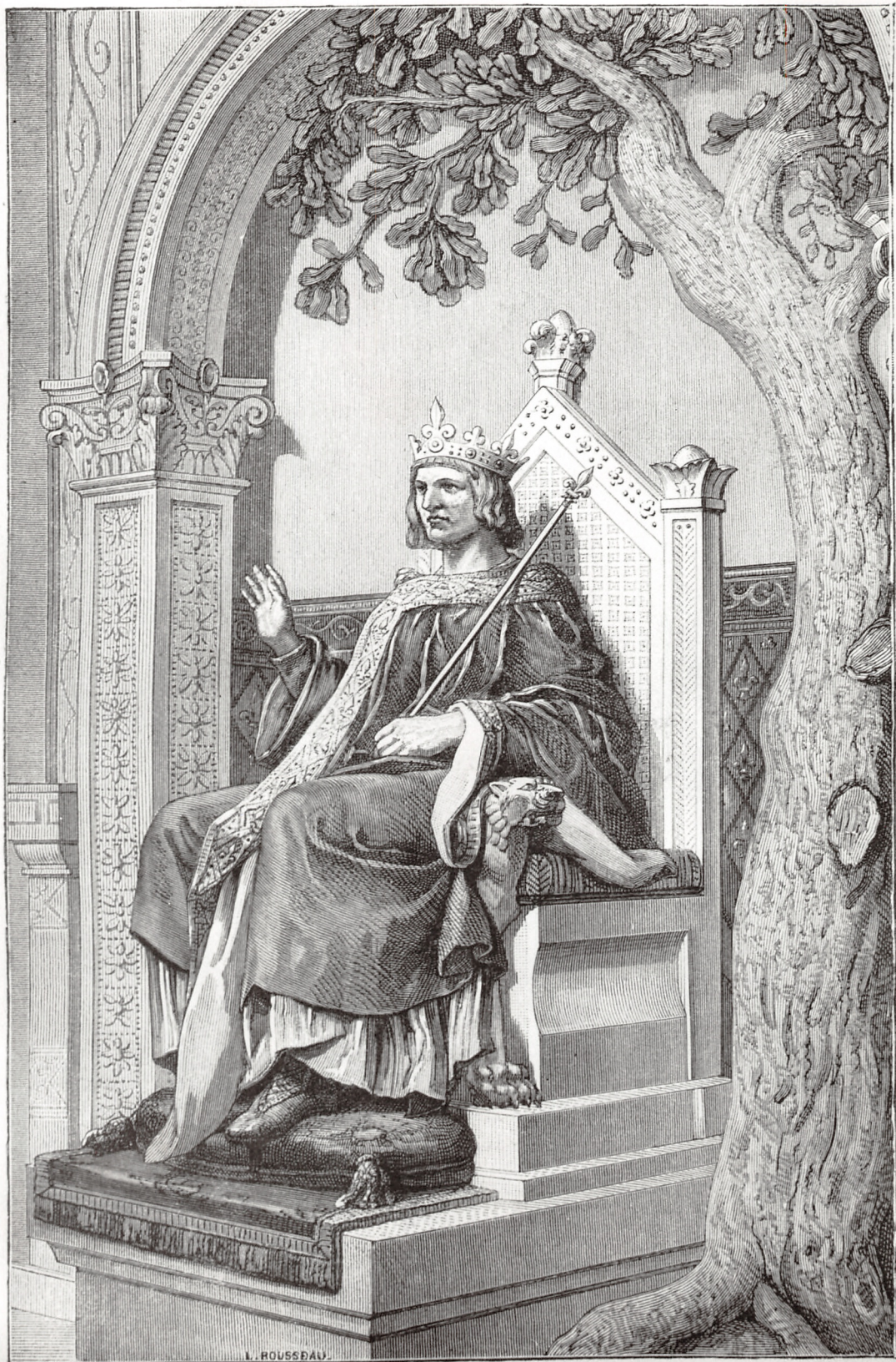
Saint Louis et le chêne de Vincennes, d'après Guillaume.