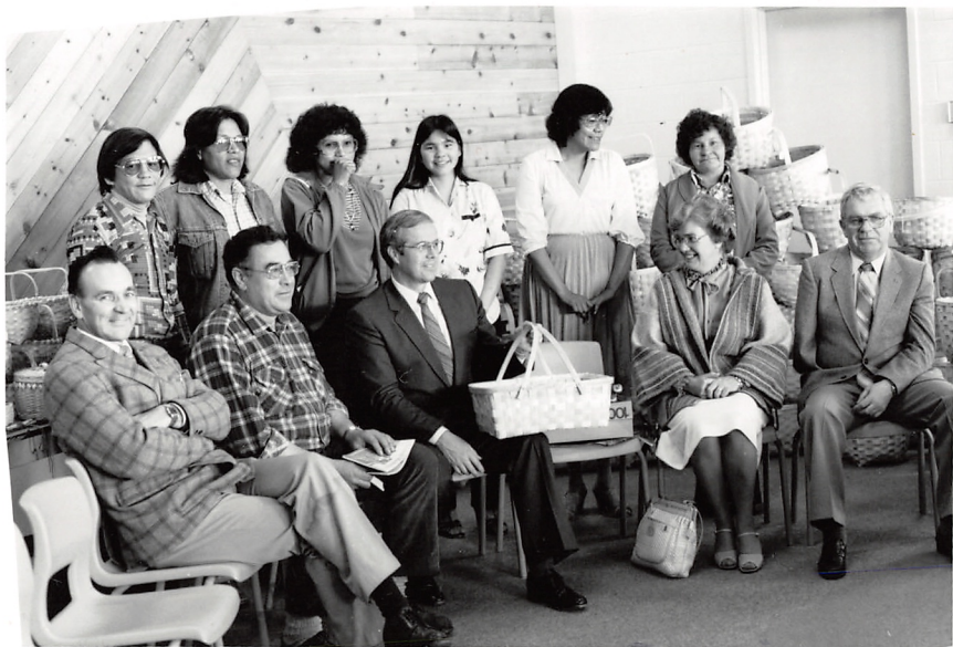
Students of Handicraft Course.